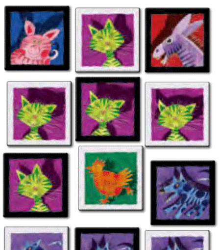
1. «Бим бамм!» с кошками.

Каждый игрок пытается сделать так, чтобы на столе оказалось пять квадратных карточек с изображением животного, нарисованного на его карте. Если такое случается, он должен как можно быстрее воскликнуть « Бим бамм! », чтобы выиграть свою карту.