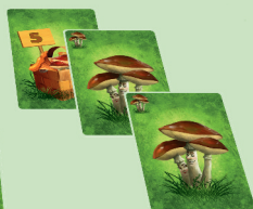
Заповнений (6 грибів)

Заповнений кошик – той, у якому грибів стільки ж або більше, ніж розмір кошика.