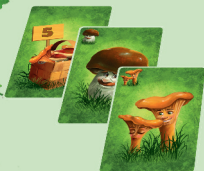
Не заповнений (3 гриби)