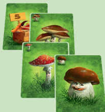
Заповнений (5 грибів)