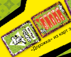
«Дорожка» из карт заданий