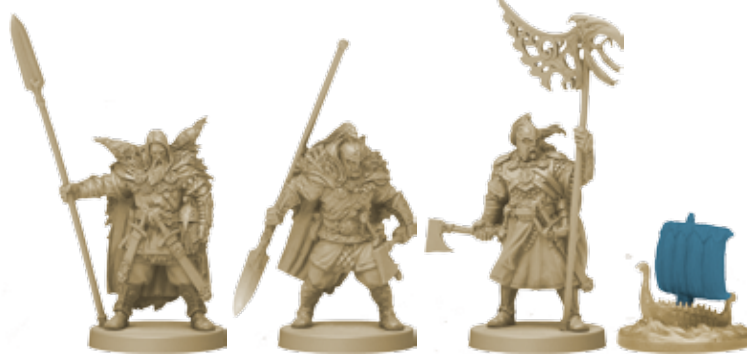
10 фигурок клана Ворона (8 воинов, 1 вождь, 1 корабль)