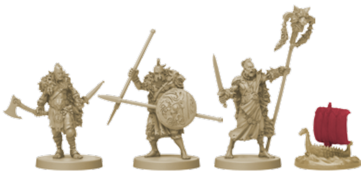
10 фигурок клана Волка (8 воинов, 1 вождь, 1 корабль)