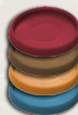
44 маленькие пластиковые подставки (по 11 на клан)