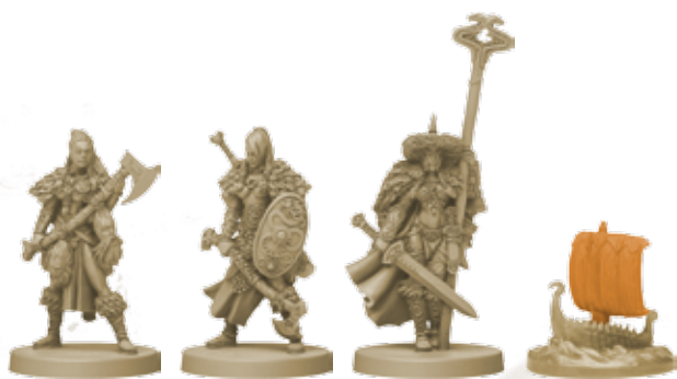
10 фигурок клана Змея (8 воинов, 1 вождь, 1 корабль)