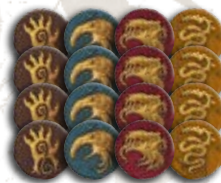
16 жетонов кланов (по 4 на клан)