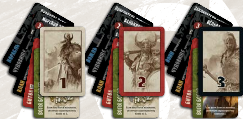
102 карты (3 колоды по 34 карты)