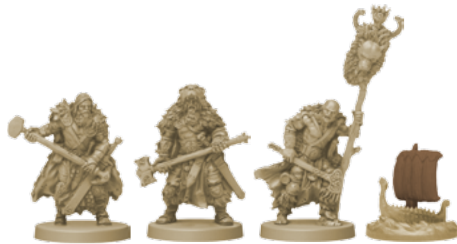
10 фигурок клана Медведя (8 воинов, 1 вождь, 1 корабль)