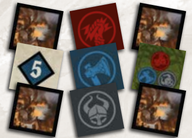
9 жетонов разграбления