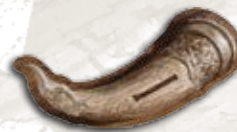
Жетон первого игрока