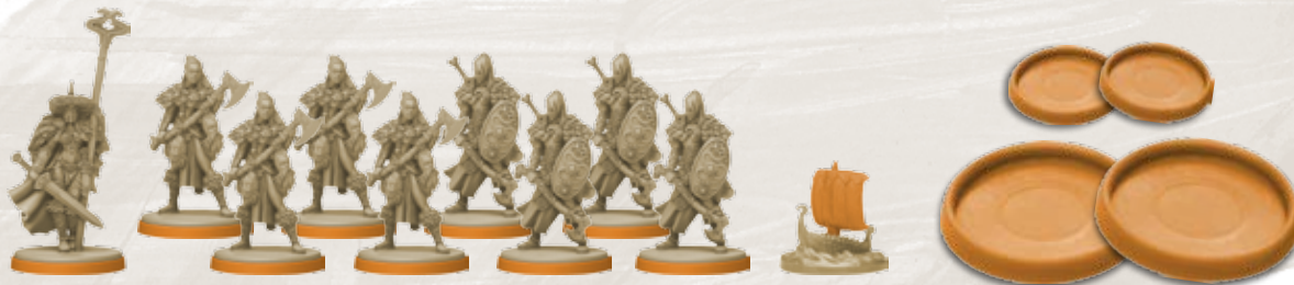
Начальные положения жетонов клана

Возьмите все свои жетоны клана . Выложите по одному из них на первые деления трёх характеристик клана (ярость, топоры и шлемы) на вашем планшете клана. Каждый клан начинает игру со следующими характеристиками: 6 ярости , 3 топора , 4 шлема . Выложите последний жетон клана на шкалу ярости своего планшета клана. Поскольку начальная характеристика ярости равна 6, этот жетон клана кладётся на деление 6.