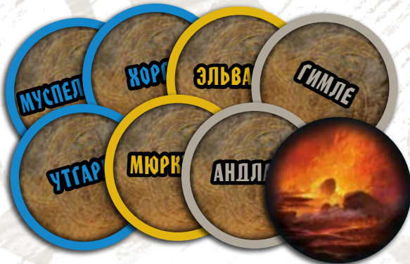
8 жетонов Рагнарёка