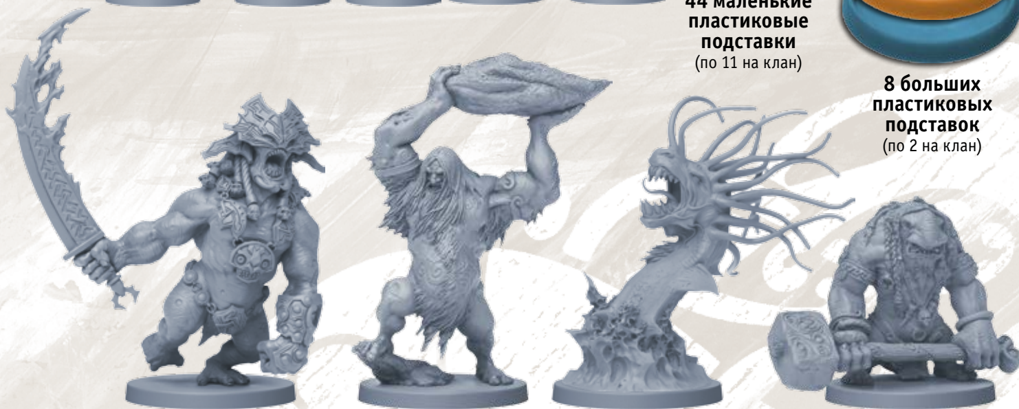
9 фигурок чудовищ