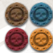
4 маркера славы (по 1 на клан)