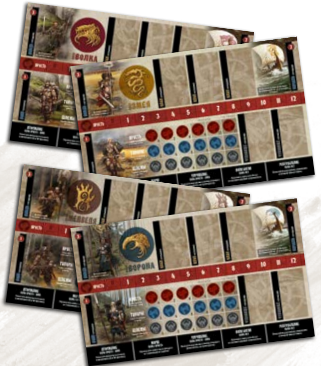
4 планшета кланов