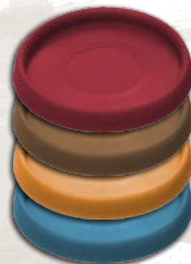
8 больших пластиковых подставок (по 2 на клан)