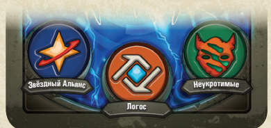
Три дома указаны на карте архонта

В каждой колоде KeyForge присутствуют 3 дома, чьи гербы изображены на карте архонта. На этом этапе активный игрок выбирает один из трёх домов, и этот дом становится активным до конца хода. Активный дом определяет, какие карты игрок может разыграть, сбросить с руки или использовать на этом ходу.