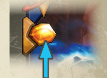
Количество полученного янтаря соответствует количеству символов янтаря на карте. Эта карта приносит 1 жетон янтаря

В левом верхнем углу (ниже герба) на некоторых картах можно найти символ янтаря. Когда такую карту разыгрывают, её владелец немедленно получает столько янтаря, сколько изображено на карте. Всякий раз, когда игрок получает янтарь (по любой причине), он помещает его в свой личный запас янтаря (на карту архонта).