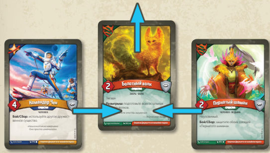
Существо из центра боевой линии покидает игру, и боевую линию смыкают

Когда существо покидает игру, сомкните боевую линию так, чтобы в ней не было пробелов.