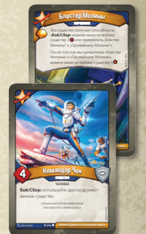
Улучшение «Бластер Молинь» прикреплено к существу «Командор Чен»

Существа: входят в игру повернутыми и кладутся перед игроком в ряд — боевую линию . Когда существо входит в игру, его карта всегда кладётся на один из флангов — на крайней левой или крайней правой позиции в боевой линии игрока. Существа остаются в игре после розыгрыша.