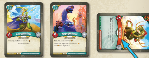
Когда существо «Кенгуслон» входит в игру, его помещают на фланг боевой линии