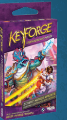
Одна из уникальных колод «Столкновения миров»

Если вы готовы к соревновательной игре, участвуйте в турнирах и чемпионатах, которые проводятся при поддержке Fantasy Flight Games Organized Play. Ищите нас на сайте KeyForgeGame.com .