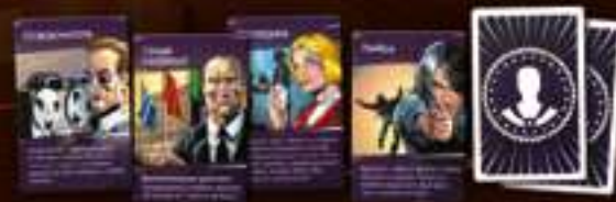
★ Мини-дополнение «Профессионалы» ★ 18 карт