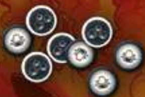
★ Теневые агенты ★ 8 жетонов