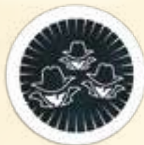
Сторона с 3 теневыми агентами