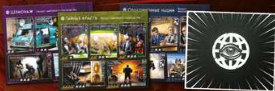
★ Проекты мирового господства ★ 4 планшета