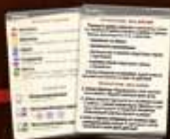
★ Памятки ★ 8 карт