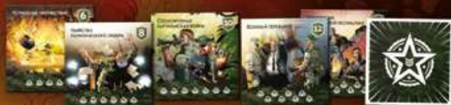
★ Спецоперации ★ 6 жетонов