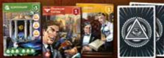
★ Объекты ★ 55 карт