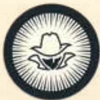
Сторона с 1 теневым агентом

Теневые агенты — это дополнительные агенты. Их жетоны двусторонние: на одной стороне изображён 1 теневой агент, а на другой — 3. Вы можете в любой момент обменять 3 жетона с 1 агентом на 1 жетон с 3 агентами.