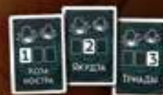
★ Жетоны союзов ★ 3 жетона (коза ностра, якудза, триады)