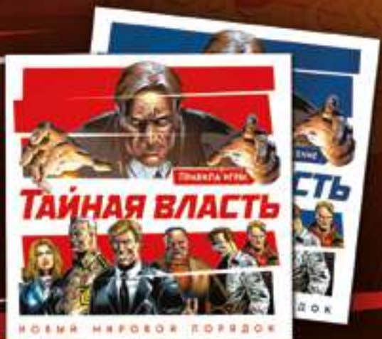
★ Правила игры и приложение ★ 2 буклета