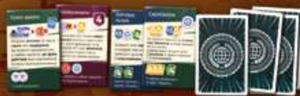
★ Союзы ★ 46 карт