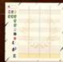
★ Блокнот ★ 48 листов