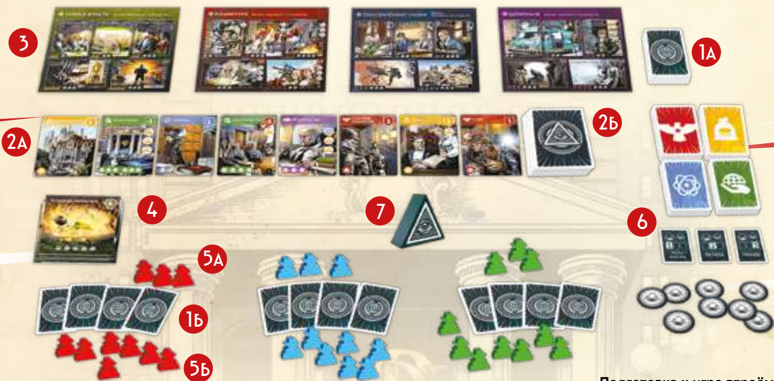
Подготовка к игре втроём

Открыв карту мировой войны, отложите её в сторону и откройте следующую карту. Выложив область внедрения , замешайте отложенные карты мировых войн обратно в колоду объектов. Таким образом, эти карты появятся в игре не раньше второго раунда.