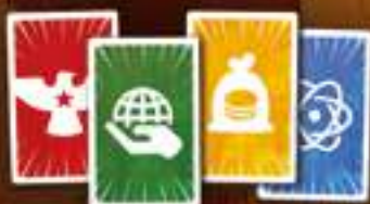
★ Второстепенные объекты ★ 34 карты