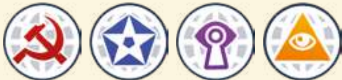
Агитаторы Миротворцы Шпионы Особый интерес