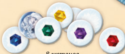
8 жетонов королевских владений