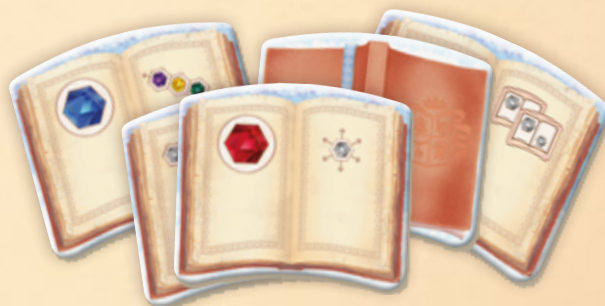
20 жетонов книг заклинаний