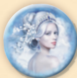
Жетон Зимней королевы (жетон первого игрока)