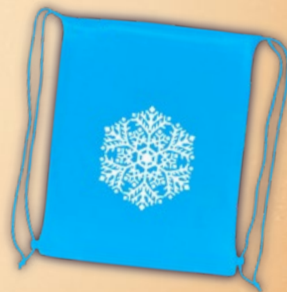
Мешочек для льдин