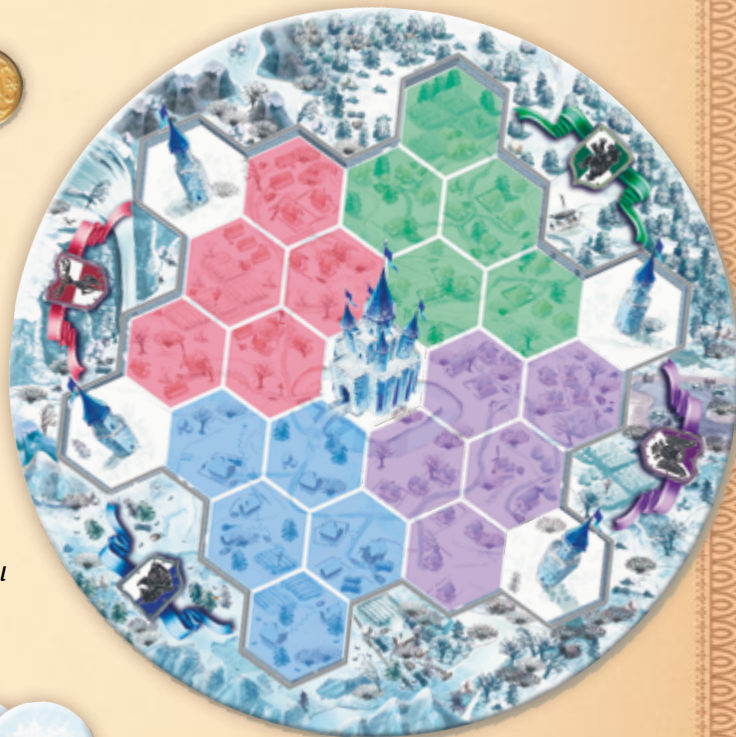
Двустороннее игровое поле с картой королевства