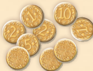
36 жетонов победных очков