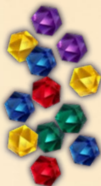
45 волшебных льдин (по 9 льдин синего, зелёного, жёлтого, фиолетового и красного цвета)