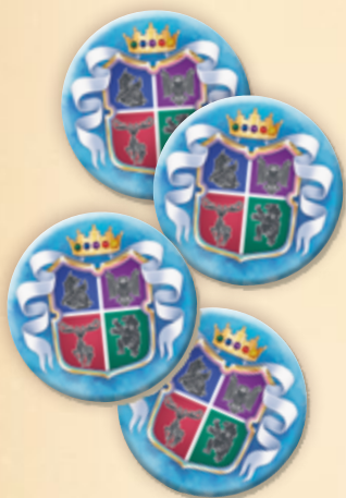
4 подставки для льдин